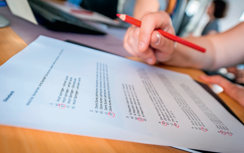
Im Lokalisierungsbereich müssen Beurteilungssysteme auf den Prüfstand gestellt werden.